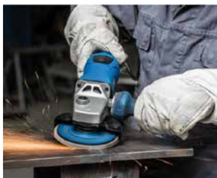
Агрессивный съём материала