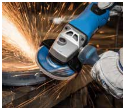
Зачистка сварных швов