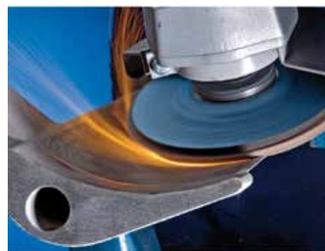
Удаление заусинцев /краски/ржавчины